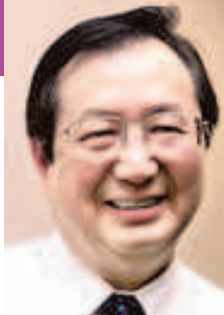
▲赖涯桥说，外交部不回应是解围的好方法。

叶伟强 报道 yapwq@sph.com.sg 24小时新闻热线：1800-822-7288 MMS传照片：9191-8727